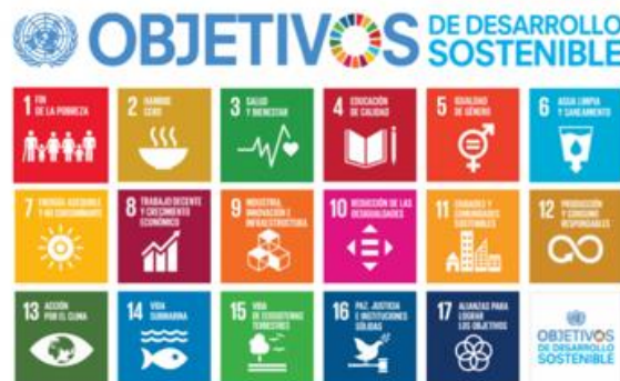
Figura 2. Objetivos de desarrollo sostenible

El plan de Desarrollo Cúcuta 2050, estrategia para todos, comprende dentro de la línea estratégica 4: Entorno protectores para un territorio en paz. Generándose una serie de compromisos, para el correcto funcionamiento de las instituciones públicas involucradas en la cadena de seguridad, justicia, paz y derechos humanos, promoviendo la construcción de la cultura de paz y entornos protectores. El proceso de planeación de las políticas públicas de seguridad y convivencia ciudadana se basan en Los siguientes Objetivos de Desarrollo Sostenible: