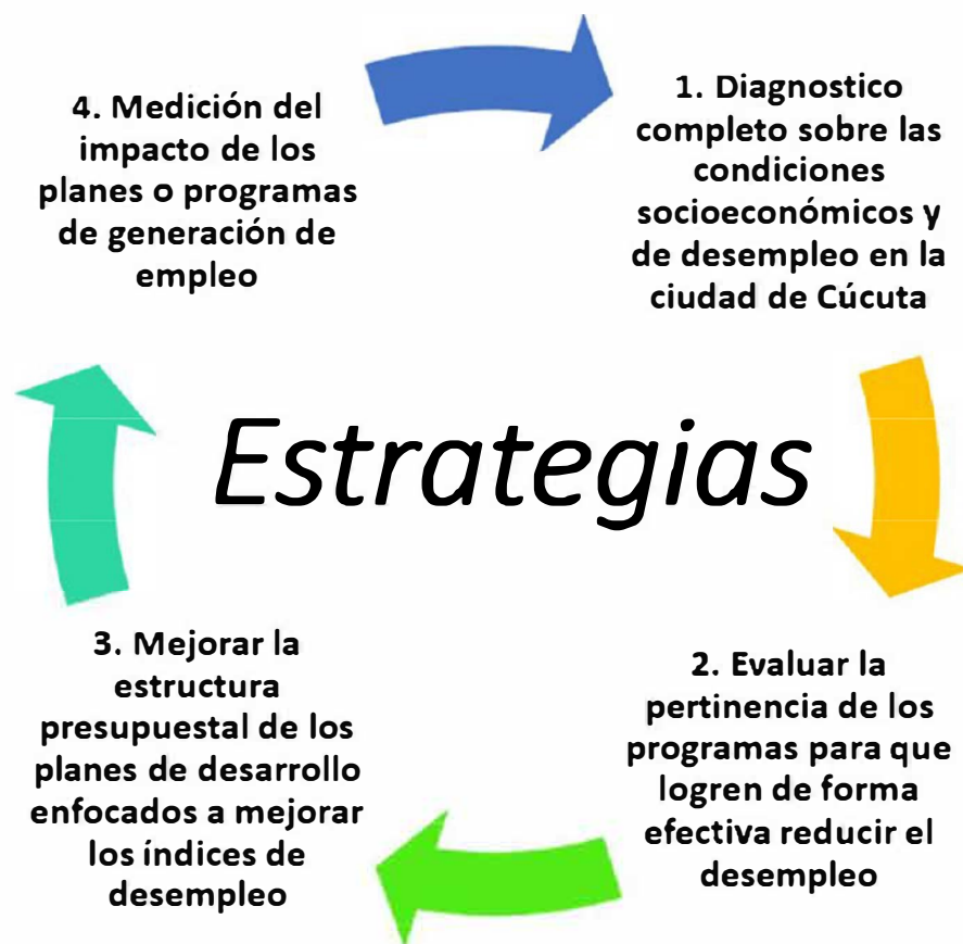
Figura 5. Estrategias para la adecuada implementación de programas, planes y proyectos dirigidos a generar empleo en la Ciudad de Cúcuta

Para definir la propuesta de mejora que permita la adecuada implementación de programas, planes y proyectos dirigidos a generar empleo en la Ciudad de Cúcuta, se establecieron cuatro líneas estratégicas para: 1. Diagnosticar las condiciones socioeconómicas y de desempleo de la población, 2. Evaluar la pertinencia de los programas para que logren de forma efectiva reducir el desempleo, 3. Mejorar la estructura presupuestal de los planes de desempleo y 4. Medir el impacto de los planes o programas de generación de empleo (ver figura 5).