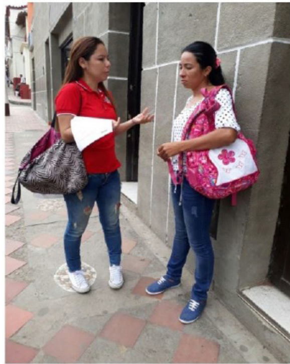
Figura 1. Trabajo de campo

Se efectuó la encuesta a los habitantes del municipio de Toledo, los cuales se les aplicó la muestra a 100 personas de diferentes edades ubicadas en los sectores agrícolas del municipio.