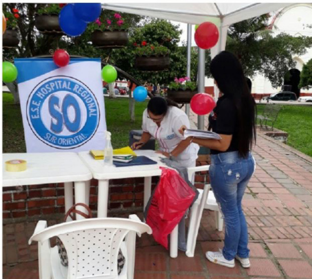
Figura 2. Trabajo de campo