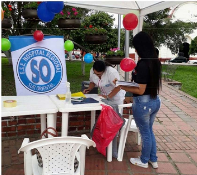
Figura 2. Trabajo de campo

A pesar que los cafeteros reciben capacitaciones para su producción no es suficiente, puesto y hay más cultivos como la caña, la cebolla, la habichuela etc, que necesitan ser supervisados y llevar el mismo proceso de capacitación para poder tener buenos resultados y así posicionar sus productos nacionales e internacionalmente que son sus metas a futuro. Ante la situación planteada debemos Establecer convenios con el gobierno departamental y nacional con el fin de Financiar las obras en vías, y de mitigación de los riesgos a los cuales está expuesto el Municipio de Toledo, la participación comunitaria será fundamental en las estrategias y las acciones específicas de reducción de riesgo en todos los sectores del municipio de Toledo.(DANE,2019)