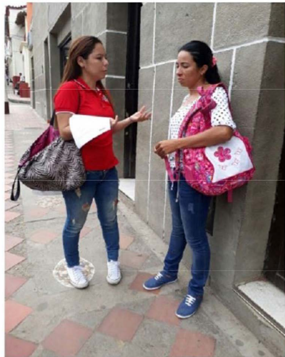
Figura 1. Trabajo de campo

Se efectuó la encuesta a los habitantes del municipio de Toledo, los cuales se les aplicó la muestra a 100 personas de diferentes edades ubicadas en los sectores agrícolas del municipio.