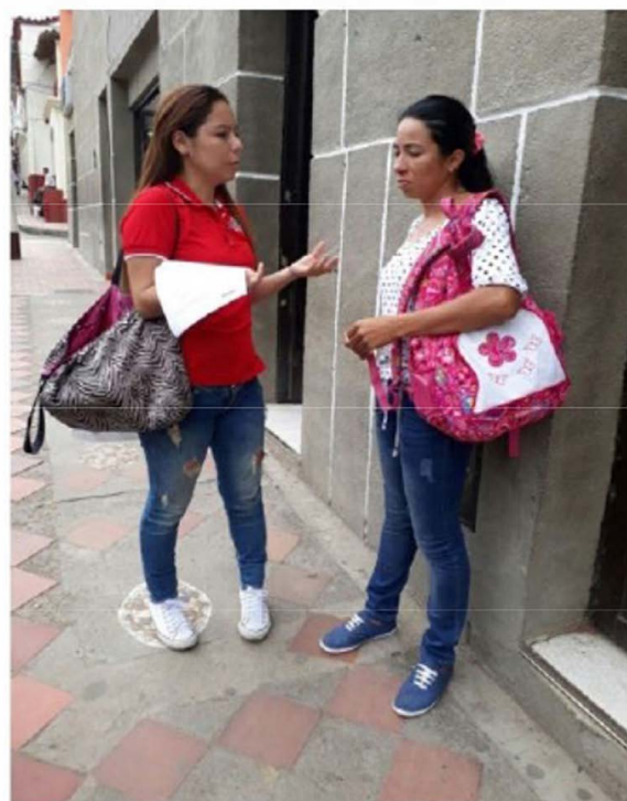
Figura 1. Trabajo de campo

Se efectuó la encuesta a los habitantes del municipio de Toledo, los cuales se les aplicó la muestra a 100 personas de diferentes edades ubicadas en los sectores agrícolas del municipio.