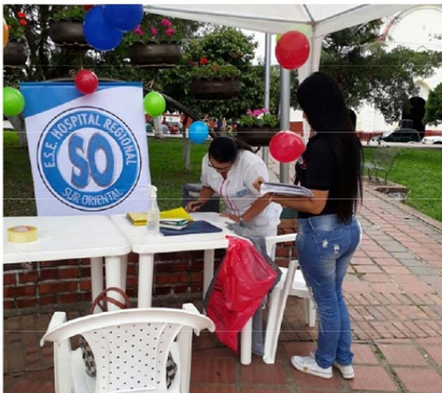
Figura 2. Trabajo de campo

A pesar que los cafeteros reciben capacitaciones para su producción no es suficiente, puesto y hay más cultivos como la caña, la cebolla, la habichuela etc, que necesitan ser supervisados y llevar el mismo proceso de capacitación para poder tener buenos resultados y así posicionar sus productos nacionales e internacionalmente que son sus metas a futuro. Ante la situación planteada debemos Establecer convenios con el gobierno departamental y nacional con el fin de Financiar las obras en vías, y de mitigación de los riesgos a los cuales está expuesto el Municipio de Toledo, la participación comunitaria será fundamental en las estrategias y las acciones específicas de reducción de riesgo en todos los sectores del municipio de Toledo.(DANE,2019)