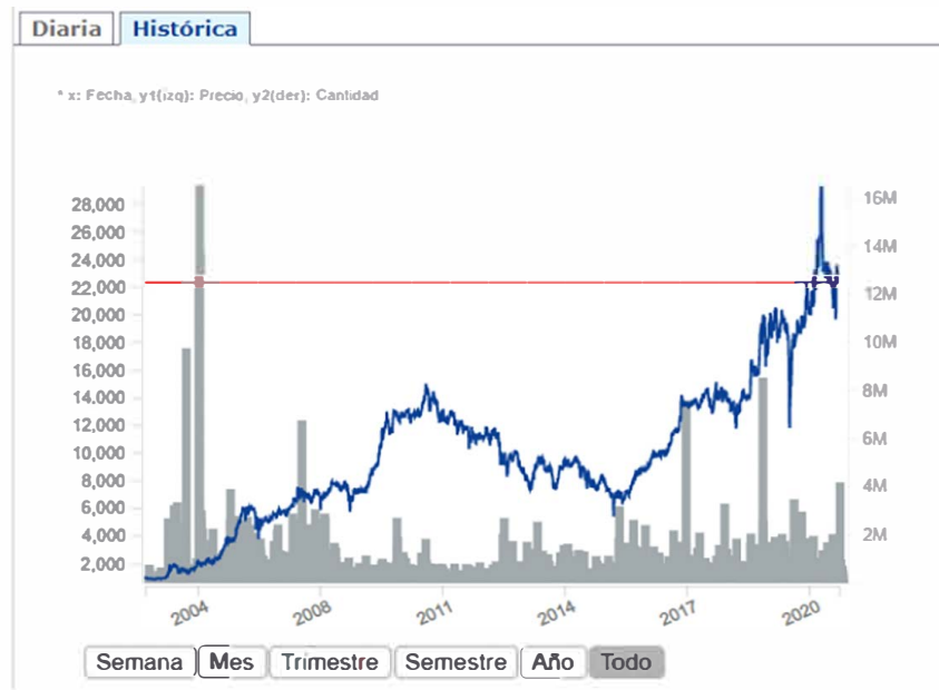
Figura 8. Comportamiento histórico cotización de mercado de la acción de ISA en la BVC.

soportar las transacciones de las acciones de ISA en el mercado secundario ante un público mayoritariamente institucional y las personas naturales que con visión compraron los títulos en la emisión primaria a COP/acción 1.000 y, que a la fecha de digitar éstas líneas el precio de mercado se ubica en COP 22.050 después de hacer precios máximos en los primeros meses del año 2021, como se observa en la figura No. 8.