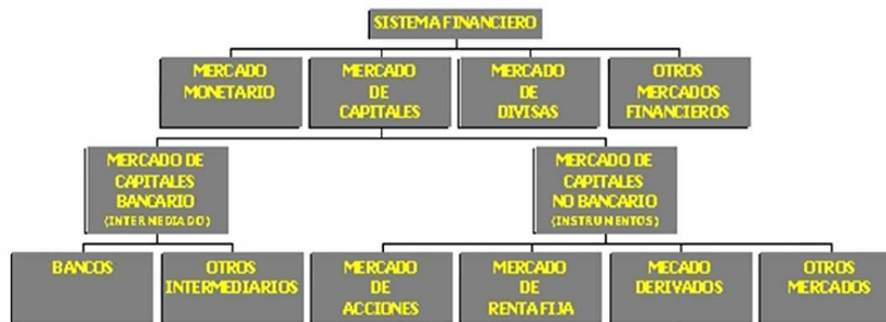
Figura 1. Estructura sistema financiero colombiano.

La caracterización del mercado de capitales, subsistema mercado de capitales intermediado o bancario se ubica al nivel del mercado monetario, mercado de divisas y otros mercados financieros OTC, ver figura No.1, se identifica porque sus títulos valores se redimen máximo a un año, siendo el más representativo los certificados de depósito a término fijo CDT a treinta días; los sobregiros bancarios son cupos preaprobados a los titulares de las cuentas corrientes las cuales disponen de talonarios con cheques y de las tarjetas débito para su operación en cajeros electrónicos. Los depósitos en cuenta corriente no devengan intereses. Entre los medios de pagos, el uso de los cheques ha entrado en obsolescencia ante la disrupción de la tecnología al servicio de los medios de pago (Franco Cuartas, Tendencia en medios de pago y la pertinencia del dinero en efectivo, 2020)