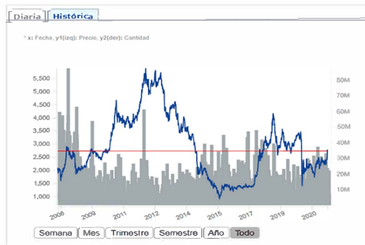
Figura 10. Comportamiento histórico cotización de la acción de Ecopetrol en la BVC

El comportamiento de la cotización de Ecopetrol a diferencia del título de Interconexión Eléctrica S.A ha presentado volatilidad, ver figura No. 10, debido a la alta correlación positiva con la cotización del barril de crudo, al principio con el WTI o el denominado liviano y luego con el crudo BRENT o pesado. Toda persona que compró acciones en la emisión primaria a noviembre de 2017 ha recibido COP 1.578 por acción en dividendos, lo que significa el 127.14% de la inversión inicial sin contar con la marginalidad del valor de mercado de la acción.