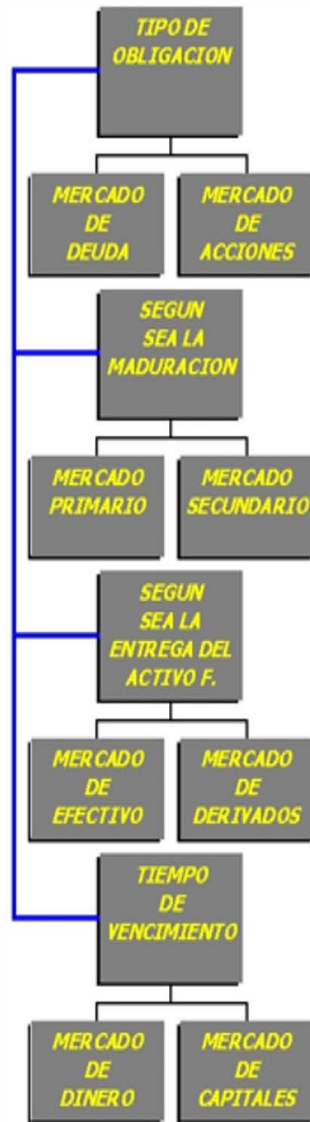
Figura 3. Clasificación de mercados en el sistema financiero.

Según sea la entrega del activo financiero figura No.3 nos enfrentamos al mercado de efectivo, spot o de contado y el mercado de derivados, a plazos, futuros o mercado de instrumentos de cobertura. Por último, la taxonomía de mercados nos habla por tipo de vencimiento, mercado monetario, inferior a un año; o mercado de capitales superior a un año