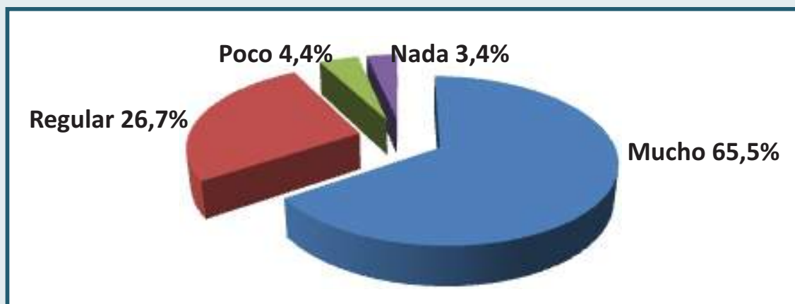
Gráfica 2. Distribución de los estudiantes, según la percepción de protección del condón o preservativo frente al VIH-SIDA, Universidad Francisco de Paula Santander, Cúcuta. 2009