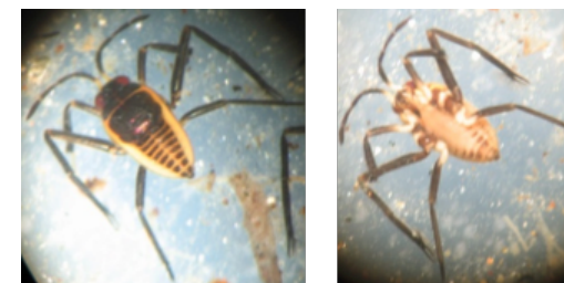
Figura 1. Orden: Hemiptera. Familia Veliidae.