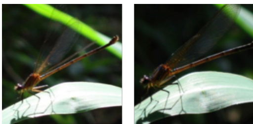
Figura 3. Orden: Odonata. Familia: Coenagrionidae. Fuente: Esta investigación. Foto: José Arnoldo Granadillo Cuello, 2012.