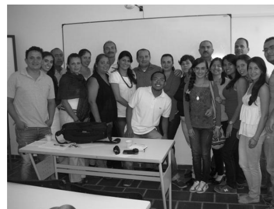
Figura 3. Firma acuerdo cooperativo