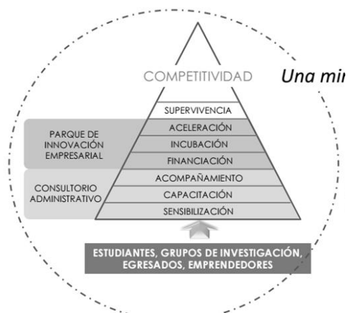
Figura 1. Modelo de Emprendimiento Universidad Nacional Sede Manizales (datos suministrados por los participantes).

la Facultad de Ciencias Administrativas y Económicas: Se observó el modelo de emprendimiento de la Universidad Nacional sede Manizales, presentó ocho etapas administradas por el Parque Nacional de Innovación Empresarial y el Consultorio Administrativo, como se puede observar en la figura 1. Una particularidad de este modelo, es su transversalidad con todos los programas académicos que dicta la Institución, así como el soporte que se le da a la comunidad que no hace parte de la Universidad.