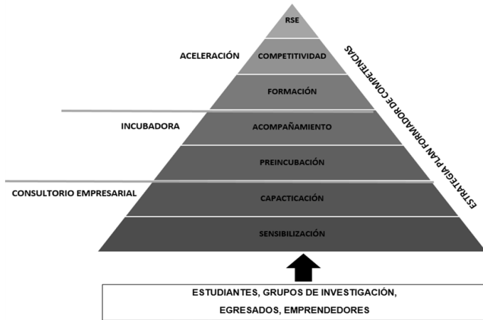
Figura 3. Modelo de emprendimiento de la UFPSO, versión No.1 (datos recabados por los autores).