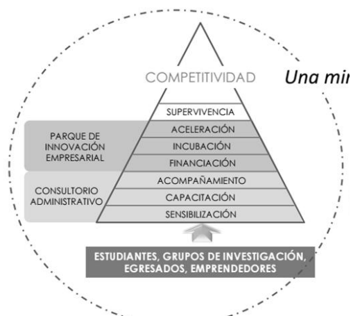
Figura 1. Modelo de Emprendimiento Universidad Nacional Sede Manizales (datos suministrados por los participantes).

la Facultad de Ciencias Administrativas y Económicas: Se observó el modelo de emprendimiento de la Universidad Nacional sede Manizales, presentó ocho etapas administradas por el Parque Nacional de Innovación Empresarial y el Consultorio Administrativo, como se puede observar en la figura 1. Una particularidad de este modelo, es su transversalidad con todos los programas académicos que dicta la Institución, así como el soporte que se le da a la comunidad que no hace parte de la Universidad.