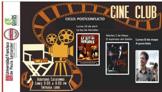
Figura 4. Películas del Cine Club en el tercer ciclo

En las secciones del cine foro se trabajó en tres pasos: aproximación: en donde se explicó la ficha técnica de la película y las características más sobresalientes del género de esta y del director, con el fin de generar cultura cinematográfica en los estudiantes. Posteriormente se proyectó la película y al finalizar esta se abrió el espacio de discusión a partir de preguntas y comentarios. Esto con el fin de generar núcleos polémicos como detonantes reflexivos sobre las realidades locales; para este caso las vivencias, memorias, experiencias de los estudiantes sobre el Catatumbo y sus problemáticas así como sus riquezas eran claves para la construcción del conocimiento.