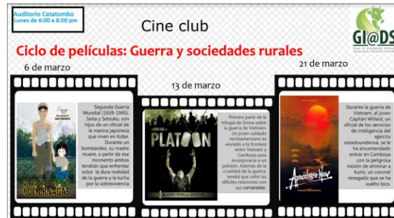
Figura 2. Películas del Cine Club en el primer ciclo

Ciclo 1: Guerra y sociedades rurales , este ciclo tenía como objetivo mostrar el escenario rural como parte fundamental de la guerra y su influencia en la comunidades que lo habitan; se buscaba evidenciar sus afectaciones, la dinámica del conflicto, la naturaleza dantesca de la guerra y sus impactos en la desmembración del tejido social. (Ver figura 2)