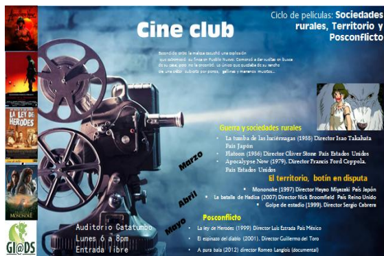
Figura 1. Publicidad del Cine Club con los tres ejes transversales

Se presentó una película cada semana los días lunes de 6:00 a 8:00 en el auditorio Catatumbo de la Universidad Francisco de Paula Santander seccional Ocaña, invitando a la comunidad universitaria en general. El cine foro contó con tres ciclos en los que se buscó destacar el posconflicto, el territorio, las sociedades rurales y realidades del Catatumbo (Ver figura 1).