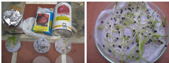
Figura 1. Pruebas de germinación de semillas de cebolla.

Se empleó un diseño experimental completamente al azar, con tres tratamientos y nueve repeticiones. Cada unidad experimental constó de una era de 10 metros cuadrados cada una. Sobre cada era se aplicó 100 gramos de semillas, esta etapa se realizó en la granja experimental de la Universidad Francisco de Paula Santander. La variable medida fue producción de bulbillos en Kg.