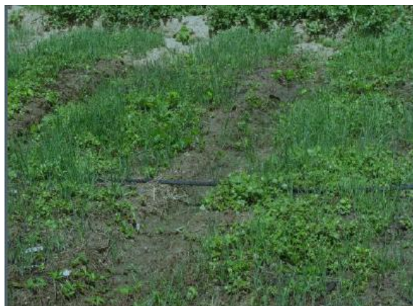
Figura 5. Desarrollo del cultivo.

por la iniciación de las lluvias. Este último material fue cosechado pero los bulbos evidenciaron mala calidad y consistencia esponjosa no apto para su siembra (Figuras 5, 6 y 7).