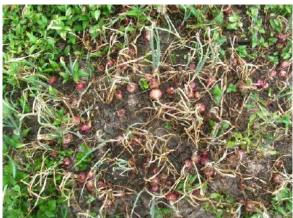
Figura 6. Desarrollo de bulbos.