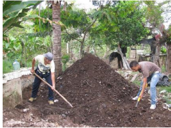
Figura 2. Preparación del Bocashi.