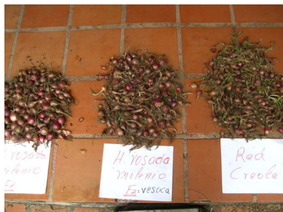
Figura 7. Cosecha de bulbos de las tres variedades de cebolla ensayadas. Fuente: Autores del proyecto.