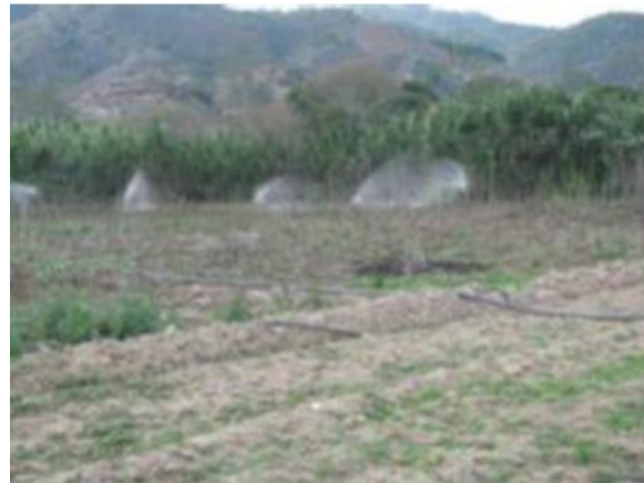
Figura 3. Sistema de riego implementado.

Segundo: Con la semilla Resaca se probaron dos densidades de siembra: 50 y 75 gramos por era, con siete replicas (eras) por cada una, para un total de 14 unidades experimentales. La variable medida fue producción de bulbillos en Kg.