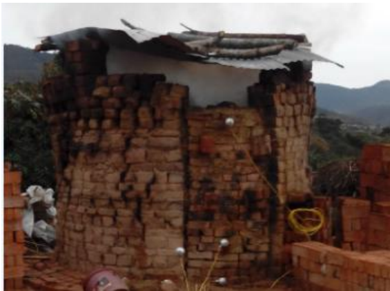
Figura 1. Horno ladrillera el recreo 2

Para el estudio de medición de gases contaminantes se escogió el horno a cielo abierto de la ladrillera el recreo 2, la ladrillera está ubicada en el municipio de Ocaña, departamento Norte de Santander, Colombia, a una altitud de 1.227 metros sobre el nivel del mar, bajo las coordenadas N 1073980 y W 1402088 con una temperatura promedio de 21°C. El horno de sección transversal circular tiene un diámetro interior de 2,12 metros y una altura de 4,52 metros con espesor de pared de 0,24 metros; la cantidad de ladrillos por quema es de 4.300 y tiene un consumo de carbón de 1.500 kg por cada cocción, (Ver figura 1).