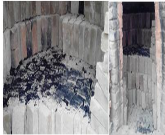
Figura 2. Cargue del ladrillo y combustible

medida que se carga el horno con ladrillos de forma ordenada, el cargue de combustible se esparce hasta una altura de 3 a 5 cm sobre cada capa armada (Cosude 2011). y se depositará en los espacios que quedan entre los ladrillos, (Ver figura 2)