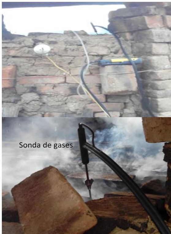
Figura 4. Medición de emisiones de gases en la ladrillera el recreo 2

Los puntos de medición establecidos para realizar las mediciones en el horno se hicieron en la parte superior por donde salen los gases producto de la combustión, (Ver figura 4), ya que este no posee chimenea.