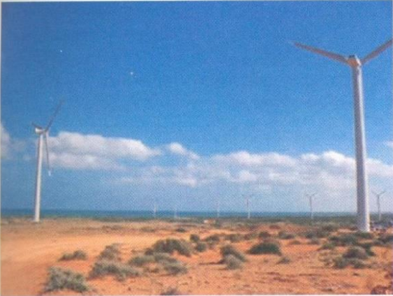
Figura 1. Aerogeneradores del parque Jepirachi

JepíACHI, significa “vientos que vienen del nordeste en dirección del Cabo de la Vela” en Wayuunaiki, la lengua nativa Wayuu, es el primer parque para la generación de energía eólica construido en el país. Es un proyecto de desarrollo de la energía eólica en Colombia, con el cual se pretende adquirir conocimientos sobre esta energía, verificar su desempeño y realizar la adaptación tecnológica a las características particulares de medio Colombiano.