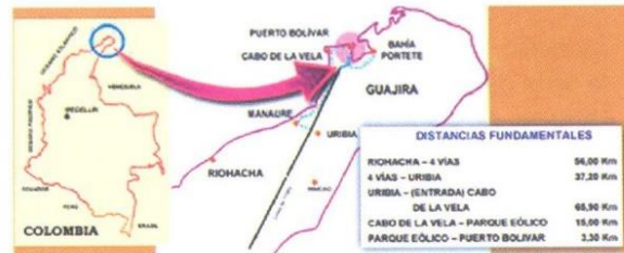
Figura 2. Ubicación geográfica del parque Jepirachi

El parque eólico JepíACHI está ubicado en jurisdicción del Municipio de Uribe, en la Alta Guajira. La construcción del parque se realizó en 14 meses y durante ella se adecuaron 11 Km. de vías, patios de trabajo, plazoletas para los aerogeneradores, se construyó una caseta para reuniones con las comunidades y se adecuaron instalaciones temporales, JepíACHI fue inaugurado oficialmente el 21 de diciembre de 2003 e inició operación plena en abril de 2004.