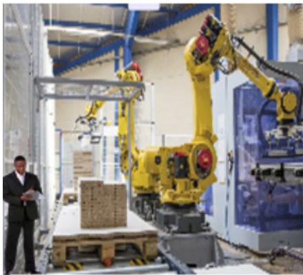
Figura 3. Humanos y robots coexistiendo.

La I.5 no se trata de que los robots y los trabajadores trabajen en solitario sino todo lo contrario quiere que coexistan trabajando los dos al mismo tiempo (véase Figura 3), trabajando sincronizadamente haciendo que el robot a la velocidad del operario, cooperando donde el robot y el operador se repartan las tareas y por último y más importante trabajando siempre en colaboración apoyándose en todo aprendiendo uno del otro [27, 28].