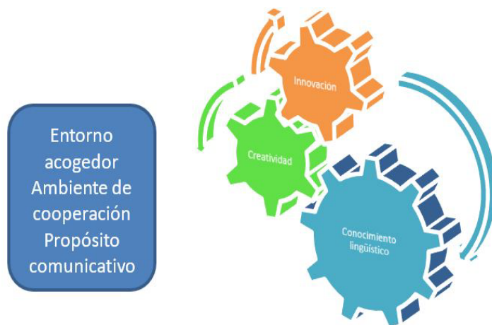
Figura 3. Interacción: innovación y conocimiento lingüístico.

Como esquema de trabajo previo se empleó el diagrama de la historia siguiendo a Dillingham (2001) el cual presenta cinco partes: 1) comienzo, 2) problema, 3) conflicto, 4) solución y 5) final (Citado en Villalustre Martínez & Del Moral Pérez, 2014). En la figura 3 se presenta la interacción de la innovación con el conocimiento lingüístico. Es preciso señalar que la activación de la creatividad y la innovación convergen en generar procesos metacognitivos que le permiten al estudiante emocionarse y así tener predisposición para reflexionar sobre sus propios procesos de aprendizaje. El uso de herramientas tecnológicas a juicio de Gamo (2012) permite: elevar la motivación, captar la atención, activar y desarrollar habilidades neuropsicológicas, evaluar para formar no para penalizar, proceso de enseñanza y aprendizaje activo, que el sujeto se identifique con la actividad, lo cual le produce emociones que otorgan posibilidades de aprendizajes significativos.