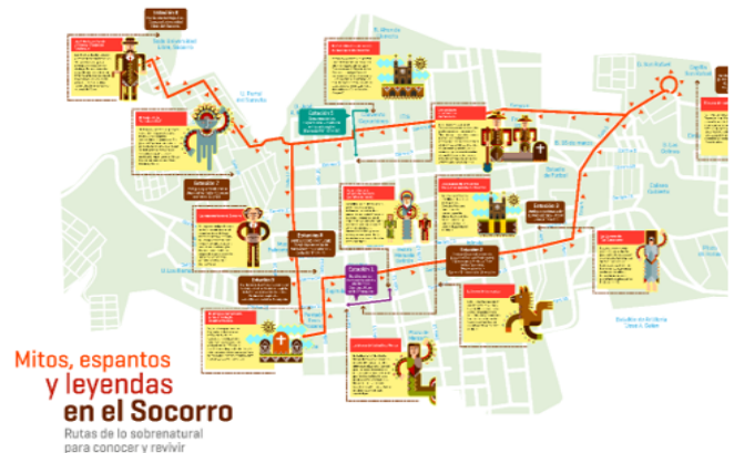
Figura 2. Recorrido “Mitos, espantos y leyendas en el Socorro”

reconocimiento que los folcloristas hacen de estas historias como narrativas que no se caracterizan solo por el habla de la gente, de sus valores y de su historia, sino también por satisfacer sus necesidades, ya sean estas de tipo emocional, didáctico, estético o recreativo (Herrera 2000), una manera de recordar aquello “que las sociedades festejan, censuran, castigan o temen” (Cortázar, 2008, p. 61).