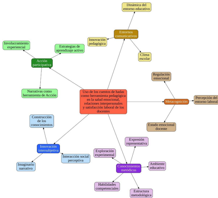
Figura 1. Estructura conceptual de las categorías emergentes y sus dimensiones asociadas

Cada categoría representa un área clave dentro de este proceso, estableciendo relaciones con códigos específicos que detallan los componentes esenciales de su impacto en la enseñanza y el aprendizaje como se puede observar en la Figura 2.