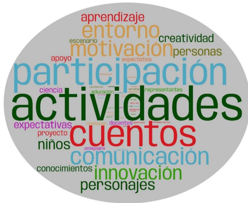
Figura 2. Visualización de la emergencia de categorías: nube de palabras extraída de las narrativas docentes