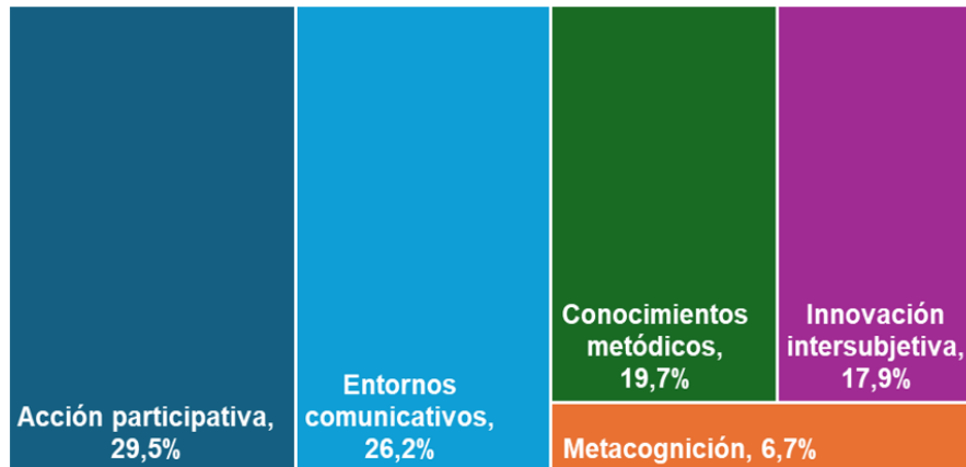
Figura 3. Jerarquización de categorías emergentes en la aproximación teórica