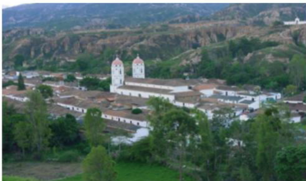
Figura 4. Panorámica La Playa de Belén, Norte de Santander

El 29 de febrero de 2012 el municipio fue exaltado por sus características históricas, arquitectónicas y culturales al “Top 10” de los destinos turísticos de Colombia y en la actualidad integra la Red de Pueblos Patrimonio de Colombia.