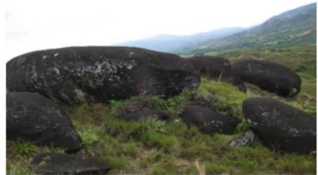
Figura 3. Piedras Negras Ábrego N.S

Como medio natural tiene la Represa del Río Oroque, Balneario de las Pailas, el Pozo del Burro, Piedras Negras y el Palo de Cuco. Piedras Negras es un Área natural y geológica de tres (3) hectáreas única en el territorio, ubicada en la vereda de Piedras Negras a 10 minutos del centro de Ábrego, cuenta la leyenda que nuestros aborígenes llegaban hasta este sitio en tiempos de luna llena para procrearse.