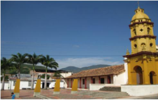
Figura 2. Complejo Histórico de la Gran Convención

En cuanto a plazas y parques, se tiene la Plazuela San Francisco, Plazuela San Agustín, Parque 29 de mayo, Plazuela de la Gran Convención.