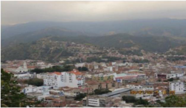
Figura 1. Panorámica Ocaña N.S

Entre los Monumentos, es importante resaltar el Monumento Columna de la Libertad de los Esclavos, único en su género por el evento que conmemora y por su aspecto arquitectónico, formada por cinco anillos concéntricos que simbolizan los cinco países bolivarianos libertados por Bolívar, está ubicado en la Plaza 29 de Mayo como Bien de Interés Cultural de Carácter Nacional.