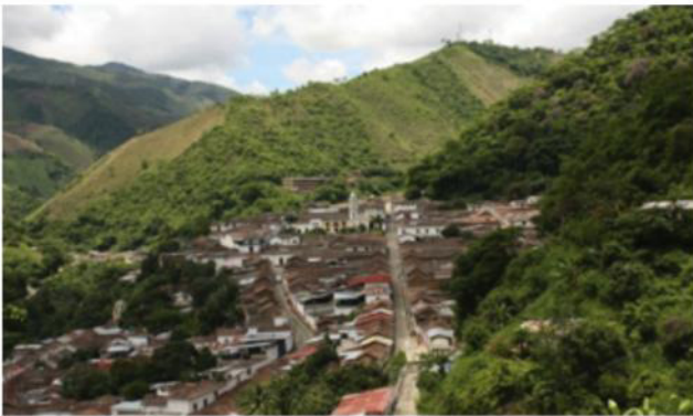
Figura 6. Panorámica El Carmen Norte de Santander

Cuenta con quince (15) grandes atractivos turísticos como: Monumento a la Virgen del Carmen y el Monumento a la Santa Cruz; el templo religioso Iglesia Nuestra Señora del Carmen con la plaza principal, que tiene siete entradas que representan las siete familias de origen y el monumento al poeta Enrique Pardo Farelo.