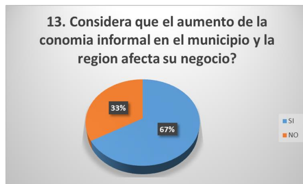
Gráfico 1. Elaborada por los autores 2019.

Al preguntar al sector comercial con respecto al aumento de la economía informal, manifestaron un 67% considera que si han aumentado la economía informal y que del mismo modo afectan su negocio y solo un 33 % considera no verse afectado por esta situación.