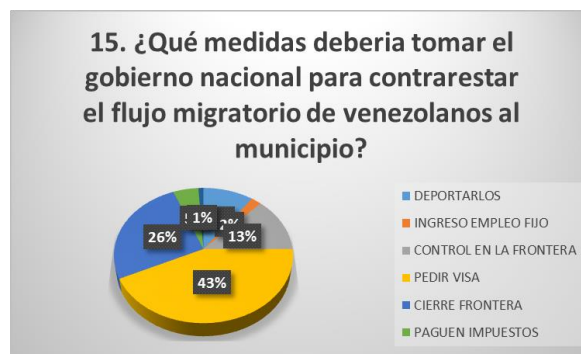
Gráfico 4. Elaborada por los autores 2019.

De igual forma al preguntarles que medidas o políticas debería tomar el gobierno nacional para contrarrestar el flujo migratorio de venezolanos. Los comerciantes encuestados respondieron: deportarlos un 10%, controlar el plazo en la frontera 4%, pedir visa 43%, cerrar la frontera 26%, ingresar con un empleo fijo 2%, pagar impuestos 5%, entregarles ayudas 1%.