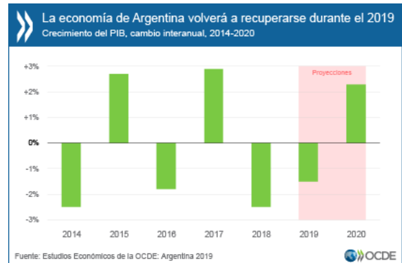
Figura 1. La economía de Argentina volverá a recuperarse durante el 2019. Fuente:(OCDE,2019,p. 1)

Para Argentina, las cifras son esperanzadoras para este año 2020, dado que presento diferentes niveles de crecimiento del PIB, tal como lo muestra la imagen adjunta.