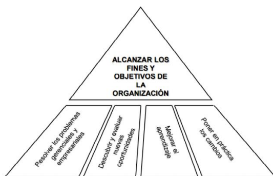
Figura 1. Objetivo consultoría empresarial.