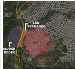
Figura 1. Ubicación general de los proyectos de viviendas gratis